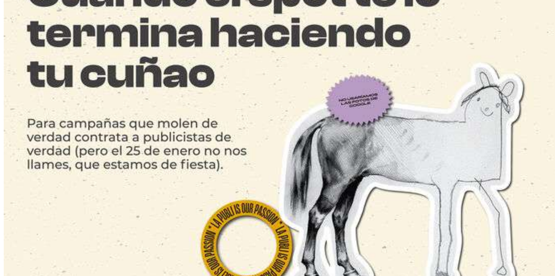
Imagen empleada en la campaña por el Día de la Publicidad. / M. G.